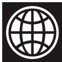
WORLD BANK GROUP

Изучение и применение лучшей практики корпоративного управления, принятой среди международных финансовых институтов.